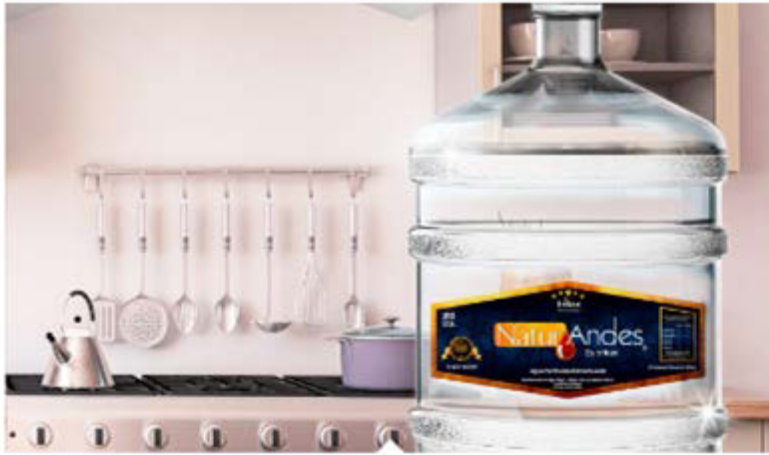
Bidón de Agua 20 Lts $8.000